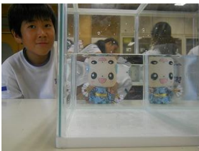
科学の時間 蜃気楼について