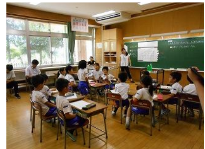
算数科の授業より